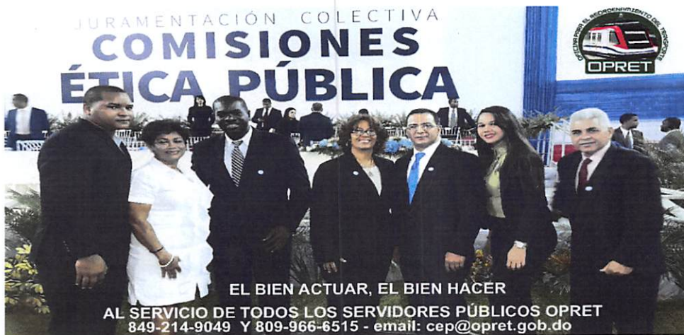
Fotografía: Miembros que integran la Comisión de Ética Pública OPRET

1.- Asesoría de carácter moral a servidores públicos, que solicitaron en el desempeño de sus funciones, además de la promoción de los recursos disponibles para tales fines.