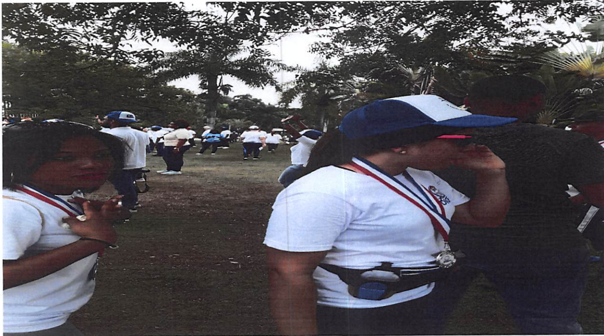
Fotografía: Marcha en el Jardín Nacional Moscoso Puello “Yo camino por la Integridad y la Transparencia”